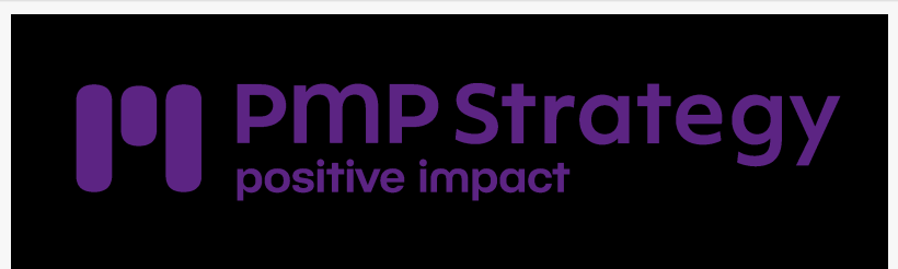
PMP Strategy logo en violet