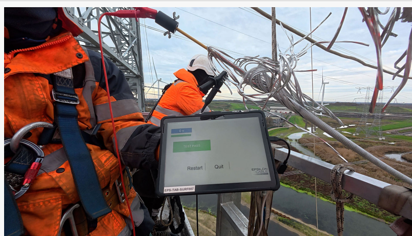
CORECHECK monitoring technology on HVCRC composite core conductor CORECHECK monitoring technology test passed

NETHERLANDS, April 20, 2026 /EINPresswire.com/ -- Im Rahmen seiner Ziele für 2045 zur Unterstützung der Energiewende setzt HVCRC-Verbundkernleiter in großem Maßstab ein, auf Basis von Rahmenverträgen mit den für die Verseilung verantwortlichen Partnern von Epsilon Cable, Nexans und De Angeli Prodotti. In diesem Zusammenhang wurde CORECHECK , die von Epsilon Cable entwickelte Technologie zur Überwachung der Integrität von Verbundkernen, erfolgreich unter realen Installationsbedingungen an einer 380-kV-Leitung validiert.