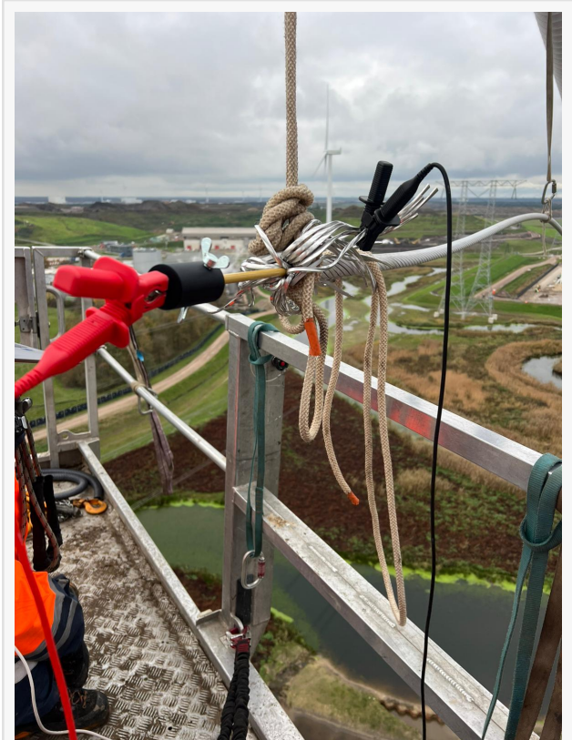
CORECHECK Test in Progress: Clamps on HVRC Composite Core Conductors

Ein technischer Beitrag zu CORECHECK wird auf der CIGRE Paris 2026 vorgestellt. Er baut auf den