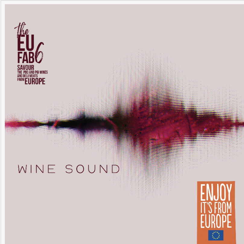
Cover Wine Sound

Le registrazioni sono state realizzate in Abruzzo, tra vigneti e cantine del territorio, su iniziativa del Consorzio Tutela Vini d'Abruzzo. Il paesaggio vitivinicolo abruzzese, con i suoi tempi, i suoi gesti e le sue risonanze, è diventato il cuore pulsante dell'album, ispirato ai Vini d'Abruzzo e al