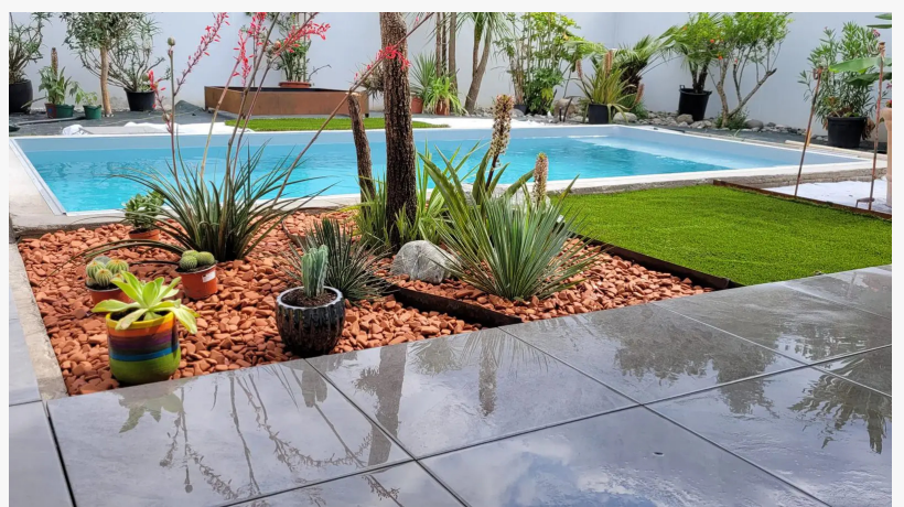
bordures de jardin

Résistance Climatique Avancée et Certification : Contrairement aux imitations ou aux aciers peints, les produits ( Bordures de Jardin , jardinières et panneaux occultants) sont fabriqués exclusivement en acier corten structurel authentique. Ce métal, certifié conforme aux normes