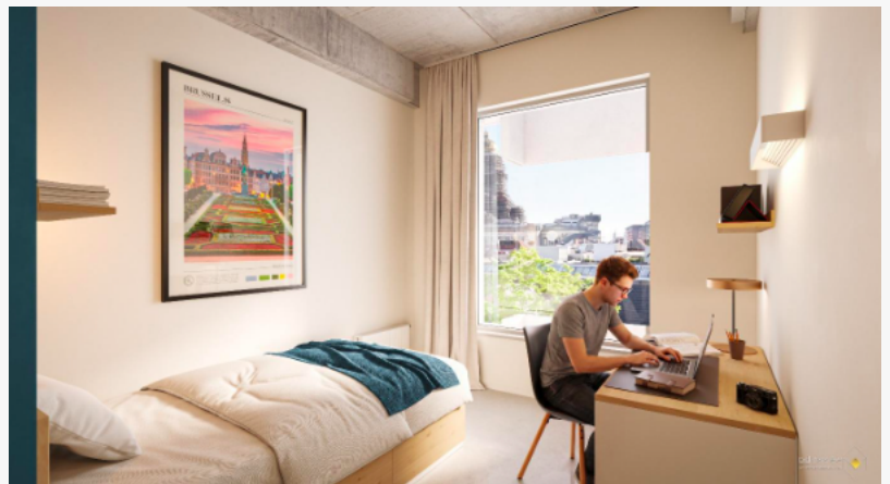
Résidence étudiante Odalys Campus à Bruxelles