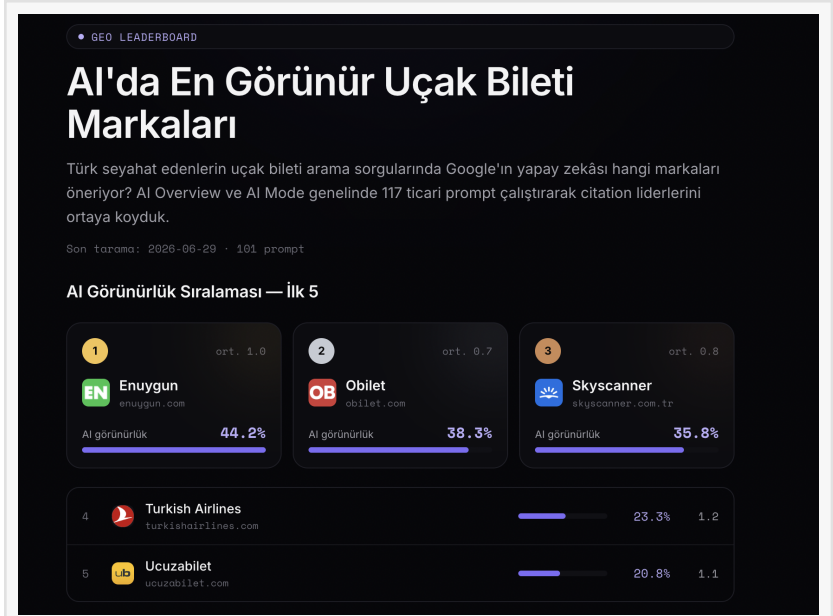
Uçak Bileti Firmaları Sıralaması