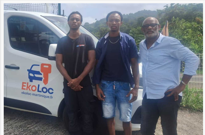
L'équipe EkoLoc Martinique pose devant l'un de ses véhicules utilitaires de location.

En s'adressant directement au marché canadien, Ekoloc veut contribuer à améliorer l'expérience des visiteurs tout en valorisant une entreprise martiniquaise indépendante. La plateforme vise autant les voyageurs québécois que les Canadiens francophones ou bilingues qui souhaitent