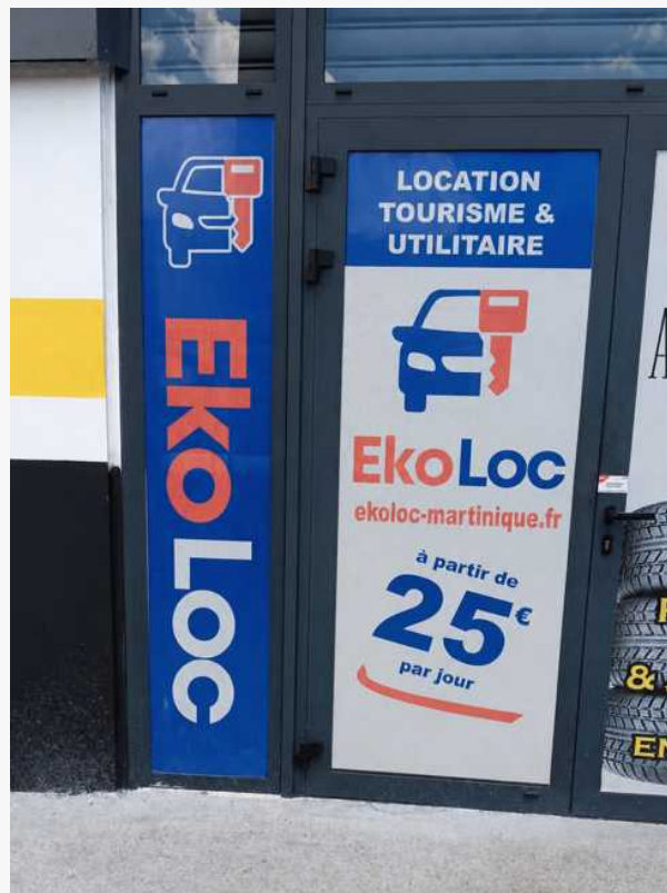
Façade de l'agence EkoLoc à Martinique, location tourisme et utilitaire dès 25 €/jour.