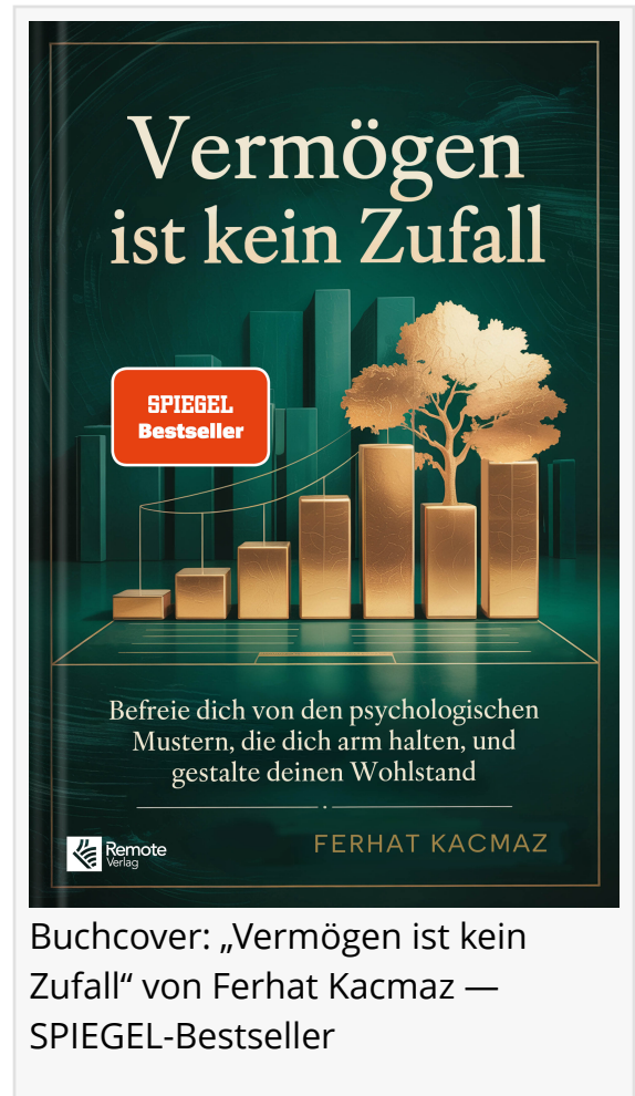
Buchcover: „Vermögen ist kein Zufall“ von Ferhat Kacmaz — SPIEGEL-Bestseller